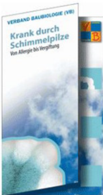
Faltblatt "Verband Baubiologie" Schimmelpilze - Von Allergie bis Vergiftung