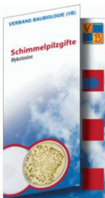
Faltblatt "Verband Baubiologie" Schimmelpilzgifte - Mykotoxine