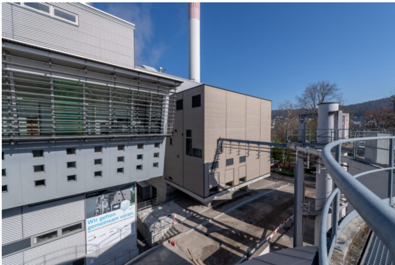
Blick auf das Power-to-Gas-Gebäude (Bildmitte).

Was im Industriequartier in der Limmattaler Gemeinde Dietikon seit einem Jahr realisiert wird, zählt zu den Leuchtturmprojekten der Schweiz. Die Power-to-Gas-Anlage, die schon bald startbereit ist, wird die grösste ihrer Art hierzulande sein und CO 2 -neutrales, erneuerbares Gas produzieren.