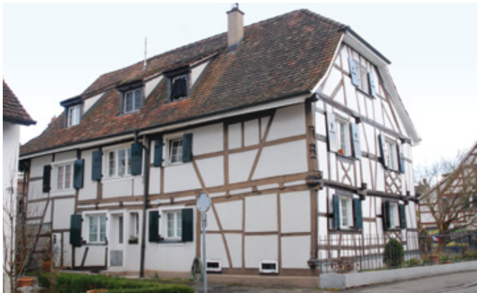
Riegelhaus in Allschwil (BL)