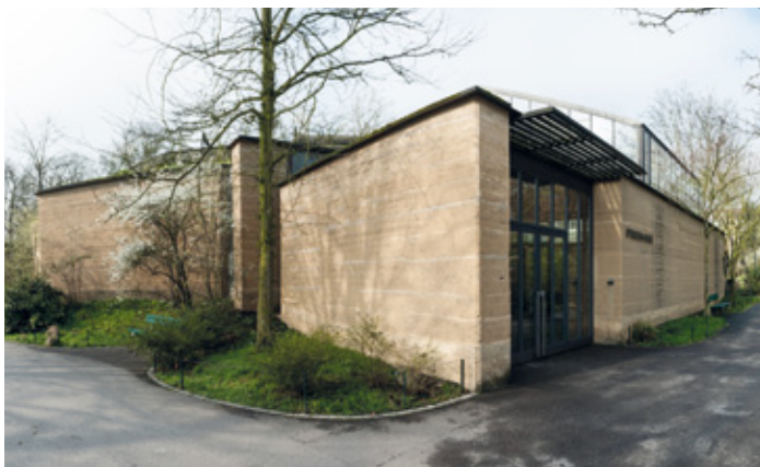
Das Etochahaus im Basler Zoo: Ein Stamplflehm aus dem Jahre 2001, der den Kreislauf des Lebens im afrikanischen Nationalpark Etocha aufzeigt.