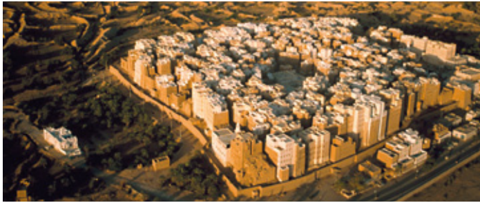
Die Stadt Shibham: «Manhattan of the Desert», eine der ältesten erhaltenen und komplett aus Lehm gebauten Städte.