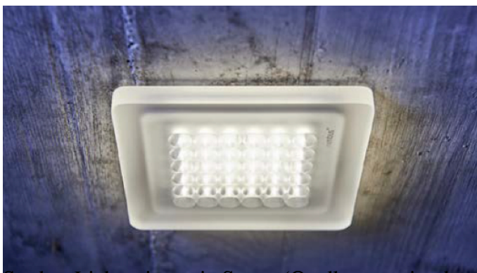
Starkes Licht mit wenig Strom.

Wer denkt, dass die LED-Beleuchtung schwach und ungemütlich sei, ist von gestern. Die Technik ist heute voll ausgereift. Gegenüber alten LED-Deckeneinbauleuchten benötigen aktuelle Modelle bis zu 65 Prozent weniger Strom. Sie haben einen grossen Abstrahlwinkel und das Licht fällt auch seitlich zur Wand. Dort wird es reflektiert, breit verteilt und zurückgeworfen. Fachleute empfehlen, die Räume und Flächen lichttechnisch bewerten zu lassen und nicht einfach möglichst starkes Licht zu installieren.