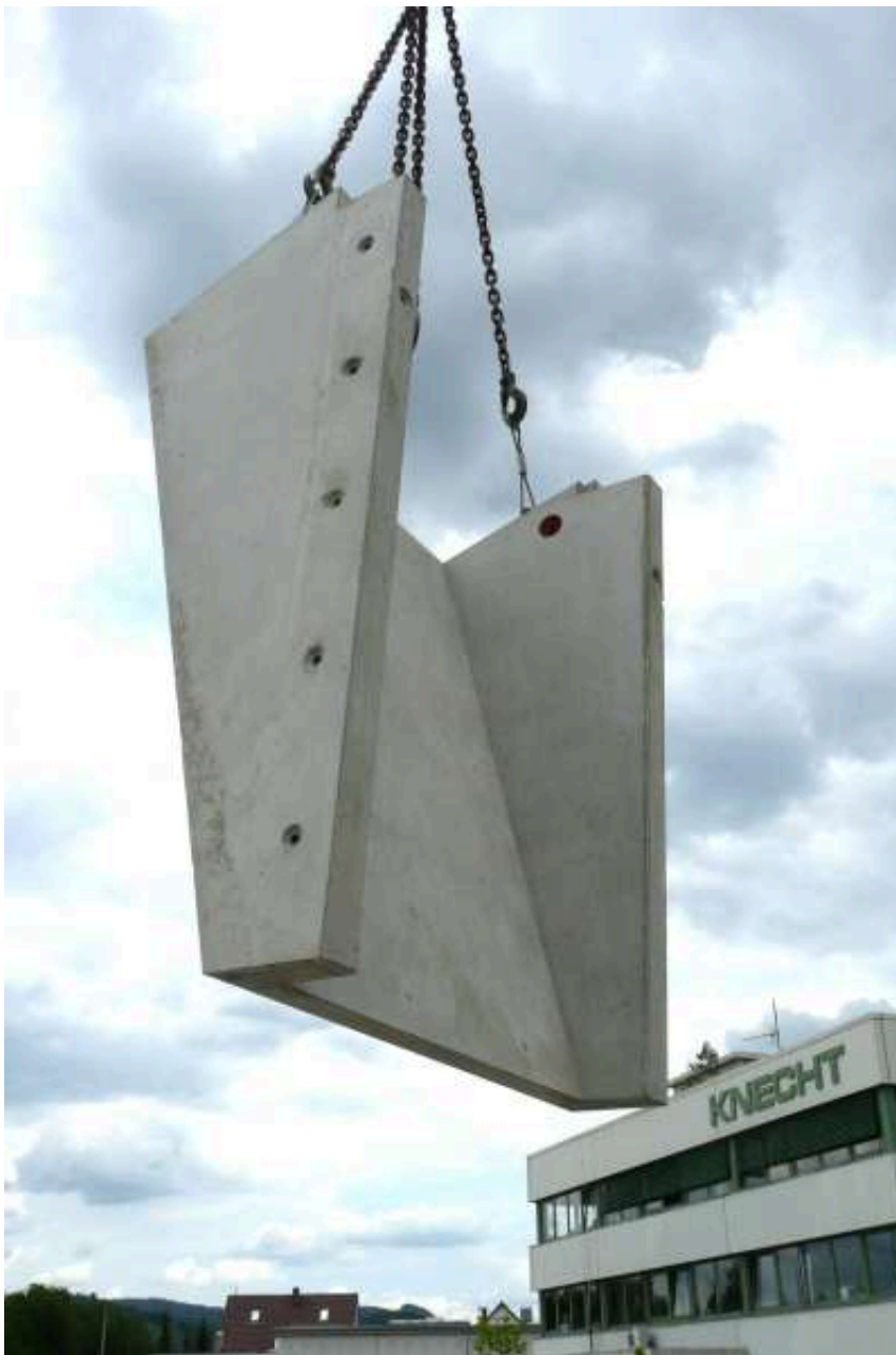
Vorfabriziert Lichtschacht, Quelle: